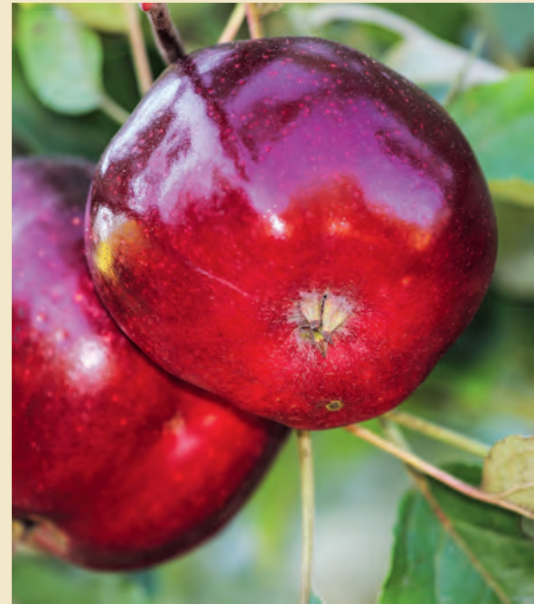
Im Obstmuttergarten des Kreisverbandes Coburg war der Ertrag dieser markanten Liebhabersorte über die Jahre hinweg gesehen relativ unregelmäßig und eher gering bis mäßig hoch.

VERWERTUNG: Die alte Sorte war früher eine beliebte Tafel- und Marktfrucht, die von Oktober bis Dezember angeboten wurde. Die Sorte eignet sich, in dünne Ringscheiben geschnitten, auch sehr gut zum Trocknen oder zur Dekoration. Thomas Neder