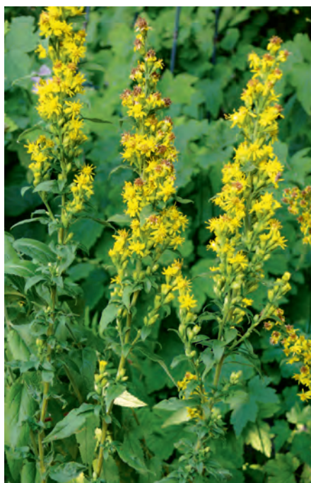
Die einheimische Gewöhnliche Goldrute ist eine altbekannte Heilpflanze.

dem tiefen Sitz der Zwiebeln sind sie vor Hackenschlägen sicher.