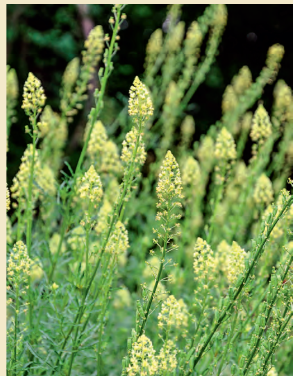
Diese langanhaltenden Blüten sind eine wertvolle Insektenquelle, können aber auch zum Färben oder gar als Heilmittel verwendet werden. Die nahe verwandte R. odorata duftet besonders gut.

VERWENDUNG: Die oberirdischen Pflanzenteile des Färberwau, vor allem die oberen blühenden Äste, wurden zum Färben von tierischen Stoff-Fasern wie Wolle oder Seide, aber auch Leinen genutzt. Als Heilmittel wirkt die Pflanze beruhigend, schmerzstillend und hilft bei Schlaflosigkeit und Unruhe. Sie kann äußerlich angewendet werden bei Quetschungen und blauen Flecken. Ulrike Windsperger