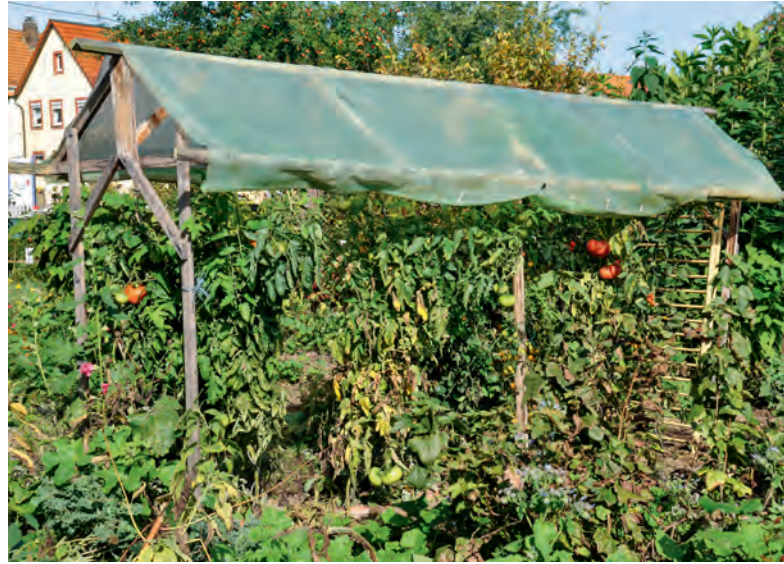
Diese Tomaten haben bis Ende September gut durchgehalten. Jetzt sollten leicht erkrankte Pflanzen dringend ausgelichtet werden, dann gibt es auch im Oktober noch pflückfrische Tomaten.

Weil man die Nachttemperatur in geschlossenen Häusern nur unwesentlich höher halten kann, das Abtrocknen dort aber extrem behindert ist, sollten alle, die nicht gleich bei Sonnenaufgang ihr Haus öffnen können, die Türe besser die ganze Nacht über auflassen – außer bei Frost. Und natürlich hält man die Bestände durch konsequentes Ausgeizen möglichst luftig.