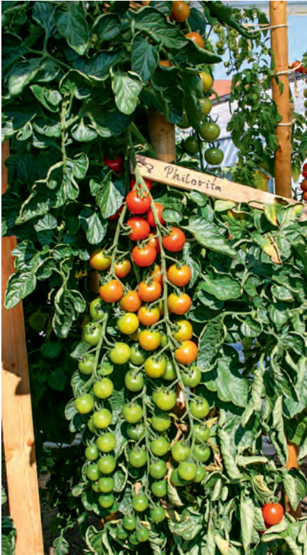
Die Sorten 'Philovita F1' kann ebenso wie die neueren samenechten Sorten 'Primavera' und 'Prima-bella' im September noch gesunden Ansatz zeigen.