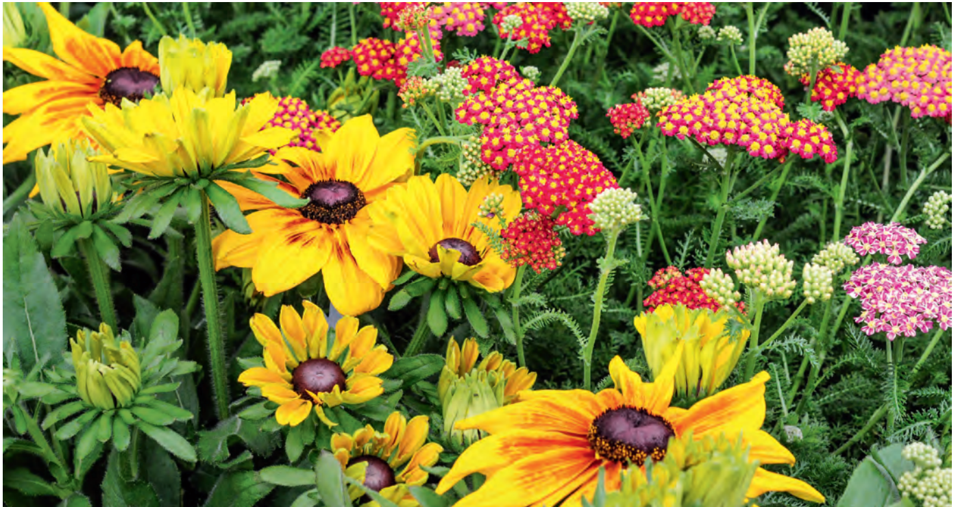
Blühendes für den Herbst: Rudbeckie neben Gartenformen der Schafgarbe mit interessantem Farbspiel in Rot- und Rosatönen