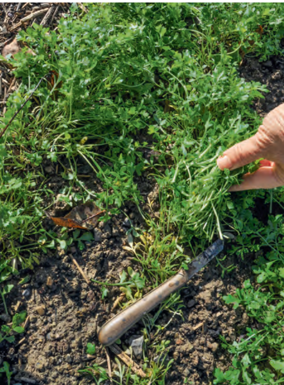
Hier wird noch Ende Oktober appetitlich zarte Kresse für Salat oder auch für Suppe geerntet.

Am letzten September-Wochenende im vergangenen Jahr fand ich die Hälfte der Krautgärten vor den Dörfern bereits umgegraben. Fleißige Leute! Leider jedoch sorgen sie für eine massive Stickstoffauswaschung ins Grundwasser! Ist nämlich der Boden noch richtig warm, blühen die Mikroorganismen wie nach jeder Bodenbearbeitung, die ihnen Luft verschafft, so richtig auf. In warmen Oktober- und Novemberwochen zersetzen sie dann Pflanzenreste und sogar Humus und setzen dabei Unmengen an Stickstoff frei. Der wandert in Nitratform ins Grundwasser. Besser für den eigenen Boden und für die Umwelt ist eine intensive Herbstnutzung der Beete.