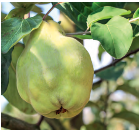
Quitten dürfen nicht zu spät geerntet werden, weil sonst leicht Fleischbräune auftritt.

Das erwachsene Tier ist ein unscheinbarer, graubrauner Falter. Die weiblichen Exemplare besitzen lediglich zu Stummeln