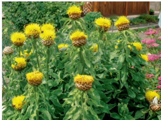
Unkomplizierte, trockenheitsverträgliche Riesen-Floerchenblume

In punkto Trockenheitsverträglichkeit und Genügsamkeit kann kaum eine andere Staude die Schafgarbe schlagen. Schließlich wächst sie in freier Natur noch auf