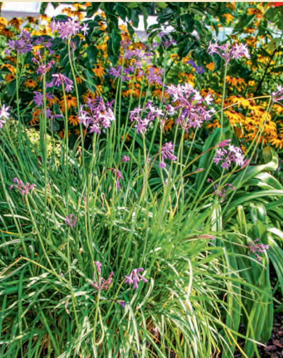
Ein südländischer Verwandter aus der Zwiebelfamilie, der sein leicht abgemildertes Knoblaucharoma auch im Winter liefern kann – allerdings nur bei geschützter Überwinterung.

Kap-Knoblauch ( Tulbaghia violacea ) heißt diese Pflanze auch, weil sie ursprünglich aus Südafrika stammt und dort bei den Zulu-Stämmen schon lange als Heilpflanze galt. Sie gehört zur Familie der Lauch- und Zwiebelgewächse ( Alliaceae ), und wie die gängigen Namen vermuten lassen, verströmt das dekorative Kraut in allen Teilen ein deutliches Knoblaucharoma, ist aber bei uns nicht winterhart.