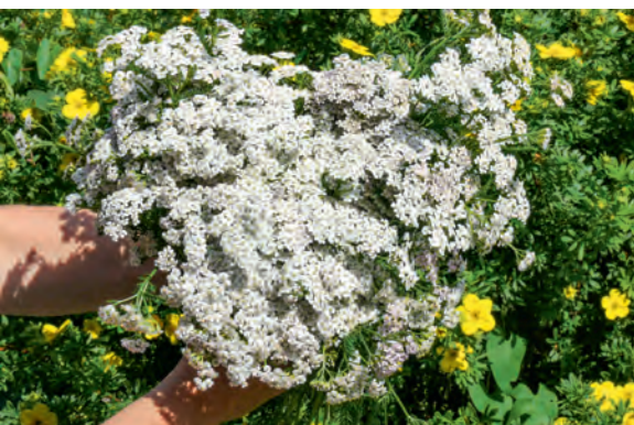
Von einem Spaziergang mitgebracht: Strauß mit Schafgarbe – zum Anschauen oder zum Trocknen

Viele unserer prächtigen Gartenblumen gehören zur Pflanzenfamilie der Korbblütler. Jetzt sorgen vor allem die nordamerikanischen Arten, die Astern, Goldruten und Sonnenhüte, für Farbe auf den Rabatten. Aber auch europäische Arten bereichern die Zierbeete mit feinen Formen und Farben. Beispielsweise die Gartensorten der einheimischen Wiesen-Schafgarbe ( Achillea millefolium ). Sie tragen wohlklingenden Namen wie 'Lachsschönheit', 'Cerise Queen' oder 'Sammetriese'.