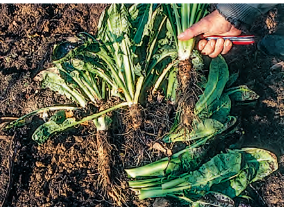
Vor dem Treiben wird das Laub über den Chicorée-wurzeln abgeschnitten.

Aus ihren gesunden, aber bitteren Wurzeln entwickelte sich zunächst die Kaffeezichorie, die der Preußenkönig Friedrich der Große feldmäßig als Konkurrenz zum echten Bohnenkaffee anbauen ließ. Zwar blieb der Erfolg dieser Maßnahme mäßig und meist auf Notzeiten begrenzt (Muckefuck, Karo-Kaffee), doch Brüsseler Gärtner fanden um 1870 zufällig heraus, dass man aus den Blattschöpfen eine weit bessere Delikatesse ziehen konnte: den Chicorée mit seinen sehr schmackhaften, zapfenförmigen Schossen.