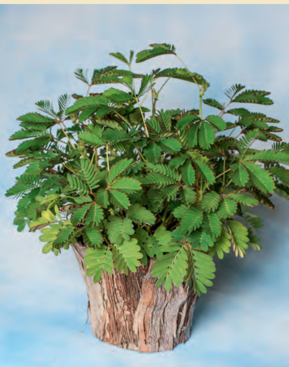
Schon im Biologie-Unterricht wirkt diese geheimnisvolle Pflanze faszinierend. Ob sich die Mimose durch ihre Bewegungen gegen Fraßfeinde schützen will ist noch nicht eindeutig bewiesen.

In den Wäldern Brasiliens ist die Mimose beheimatet. Sie gehört zur Familie der Schmetterlingsblütler und ist verwandt mit unseren Bohnen und Erbsen. Die botanische Bezeichnung Mimosa pudica spiegelt auch den deutschen Namen »Sinnpflanze« (auch Rührmichnichten) wider, denn pudica (lat.) bedeutet »schamhaft«.