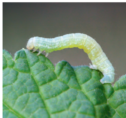
Die Frostspannerbekämpfung durch Leimringe muss Ende September erfolgen.