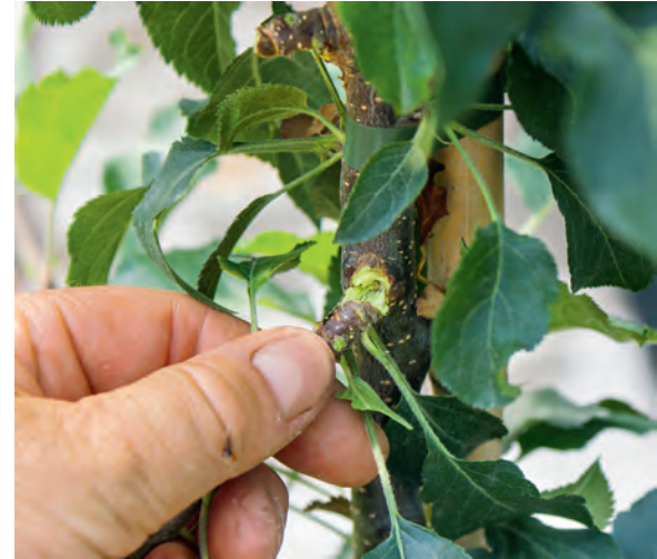
Erst wenn der Mitteltrieb zu hoch wird, sind eventuell überschüssige Seitentriebe auszureißen.

Neben den Fruchtarten gibt es unter den Säulenartigen Sorten wie 'Maypole', 'Silver Pearl' oder 'Red Lane', bei denen aufgrund der geringen Fruchtgröße der Zierwert von Blüte und Fruchtschmuck im Vordergrund steht. Aber auch die kleinen Äpfelchen können verarbeitet werden (v. a. Saft, Gelee, Mus). Die herrlich rot blühende, im Austrieb rotlaubige, jährlich gut fruchtende 'Red Lane' zeichnet sich überdies durch mehr oder weniger rötliches Fruchtfleisch aus. Dies ergibt leicht rötliches Gelee, Mus oder Saft.