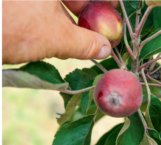
Damit sich ausreichend große und aromatische Früchte entwickeln, sollte man die Büschel auf Einzelfrüchte ausdünnen.

Bei Überbehang bilden sich kleine und geschmackliche schlechtere Früchte aus. So erfordert ein üppiger Fruchtbehang eine konsequente Ausdünnung gegen Anfang bis Mitte Juni: die in Büscheln