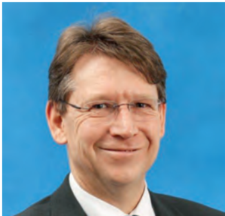
Stephan Rößle Landrat des Lkr. Donau-Ries