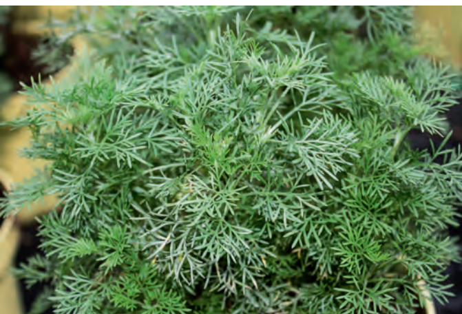
Das fein gefiederte Laub dieser Eberraute überrascht mit einem intensiven Cola-Aroma.

Interessant sind die »süßen« Kräuter, zum Beispiel Colakraut, Limonadenpflanze, Kaugummistrauch und Fruchtgummipflanze, deren Duft man sich schon beim Hören der wohlklingenden Namen vorstellen kann. Aus den Blättern und Blüten lassen sich Tees und Limonaden zubereiten, sie verfeinern Süßspeisen, Eis, Muffins und mitunter auch mediterrane oder deftige Gerichte. Ausprobieren ist da angesagt, zumal die Pflanzen nicht nur gut duften und schmecken, sondern auch noch mit hübschen Blüten aufwarten und sich im Kräuterbeet genauso gut machen wie zwischen den Stauden. In gut sortierten Gartencentern und Gärtnereien werden Sie die Pflanzen finden, aber auch bei speziellen Kräuteranbietern im Internet.