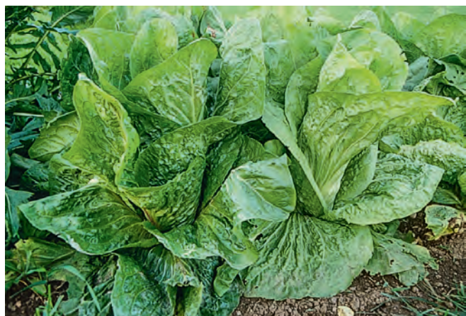
Von den walzenförmigen Köpfen des Zuckerhuts kann man sich nach Bedarf Scheiben abschneiden.

Die Chicoree-Zubereitung passt auch zum Zuckerhut (in der Schweiz wird er Fleischkraut genannt). Erst im Oktober/November schließen sich seine Blätter zu walzenförmigen Köpfen, die sich im Gemüsefach des Kühlschranks monatelang frisch halten. Man schneidet einfach wie bei einer Salami für den Tagesbedarf einige Scheiben ab und gibt die leicht herb schmeckenden Streifen als Appetitanreger unter Mischsalate. Die Soße dazu wird nach italienischen Balsamico-Rezepten frisch zubereitet oder nach französischer Art mit Senf oder mit fertigen Mischungen.