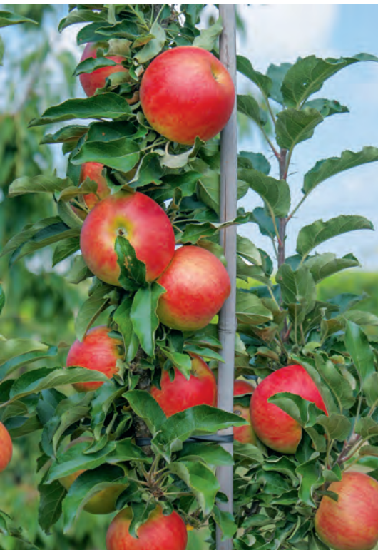
Sorten der zweiten Säulenäpfel-Generation wie 'Starcats' (o.) zeigen deutlich verbesserte Geschmacksqualität.

'Pidi' wächst sehr schwach und kompakt, mit leichter Verzweigung, und könnte auch als Säule kultiviert werden. Er reift Ende September; kleine bis mittelgroße Frucht, gelb mit leuchtend roter Deckfarbe, saftig, ausgewogener Geschmack mit feinem Aroma.