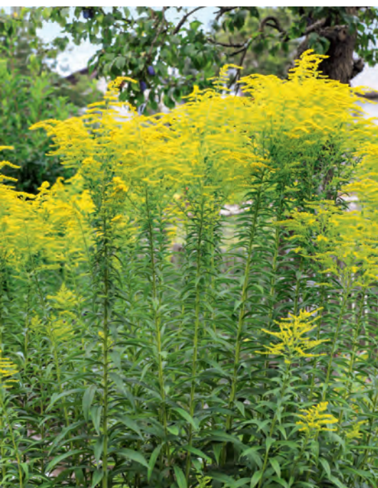
Die Kanadische Goldrute blüht, wenn die Zwetschgen reifen.