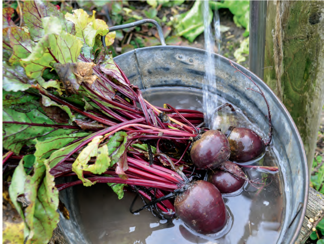
Ein einfacher Waschplatz erfüllt seine Funktion bestens. Sicher gibt es auch noch elegantere Lösungen.

müsen (Griechischer Salat mit Feta und Oliven), Tomaten mit Mozzarella und natürlich mal mit einem anderen Öl, anderen Kräutern oder auch mal mit Zitronensaft anstelle von Essig.