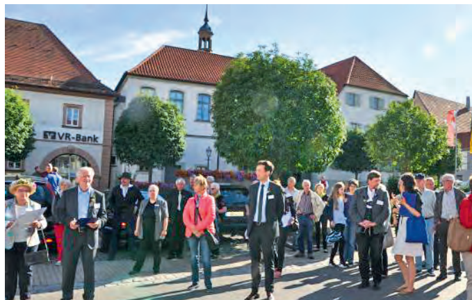
Auch Präsident Wolfram Vaitl nahm sich Zeit, mit der Bundeskommission die bayerischen Golddörfer zu besuchen – hier in Geldersheim.

Auf Bundesebene wurden 10 Gold-, 17 Silber- und 6 Bronzemedailen vergeben. »Mit 2 Gold- und 2-Silbermedaillen hat Bayern hervorragend abgeschnitten«, so Günter Knüppel vom Bayerischen Staatsministerium für Ernährung, Landwirtschaft und Forsten. Perlesreut erhielt außerdem den erstmals vergebenen Sonderpreis für »herausragende Projekte zur Bewältigung des demografischen Wandels«, der mit 3.000 Euro dotiert ist.