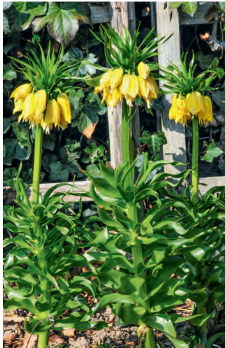
Stolze Erscheinung auf der Rabatte: Gelbe Kaiserkrone

Kaiserkronen wollen einen offenen, sonnigen Stand. Jetzt ist Zeit, um die fleischi-