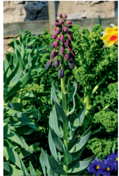
Die Persische Kaiserkrone fällt durch ihre außergewöhnliche Blütenfarbe auf.

gen Zwiebeln 20–30 cm tief in den Boden zu versenken. Die Zwiebelblumen sind anspruchsvoll; der Boden sollte nahrhaft und lehmig-humos, dabei durchlässig sein. Bei Nährstoffmangel und bei schattigem, be-drängtem Stand lassen Kaiserkronen sonst in der Blüte immer weiter nach und bilden schließlich nur noch Blattschöpfe aus.