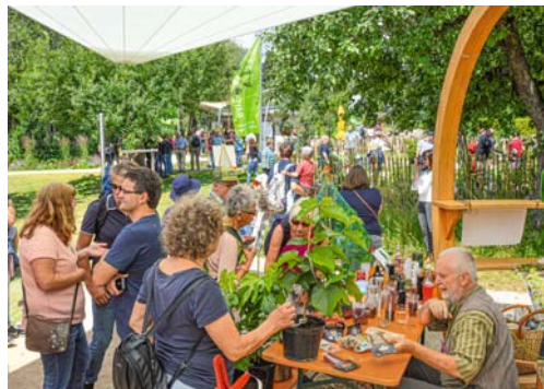
Im Holz-»Apfel«, der während der gesamten Gartenschau von den Landwirtschaftlichen Lehranstalten Triesdorf zur Verfügung gestellt wurde, warben die Gartenbauvereine aus Windsfeld und Geilsheim für die Maulbeere.