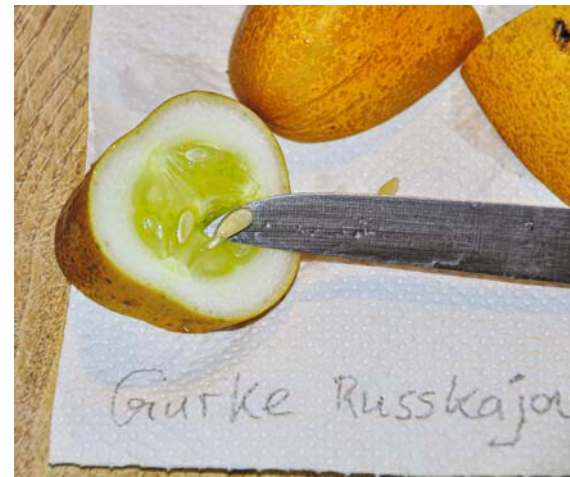
Aus den voll ausgereiften Gurken lassen sich unversehrte Körner herauslösen – für die meisten Selbstversorger genügen wenige Körner.

Ist das Blatt mit den Samen, das ich bei mäßiger Wärme auf die Heizung lege, trocken, falte ich es zusammen und lagere die Pakete kühl in einem Folienbeutel. Zur Anzucht ab Februar kratze ich die Körner ab – man braucht ja von jeder Sorte nur