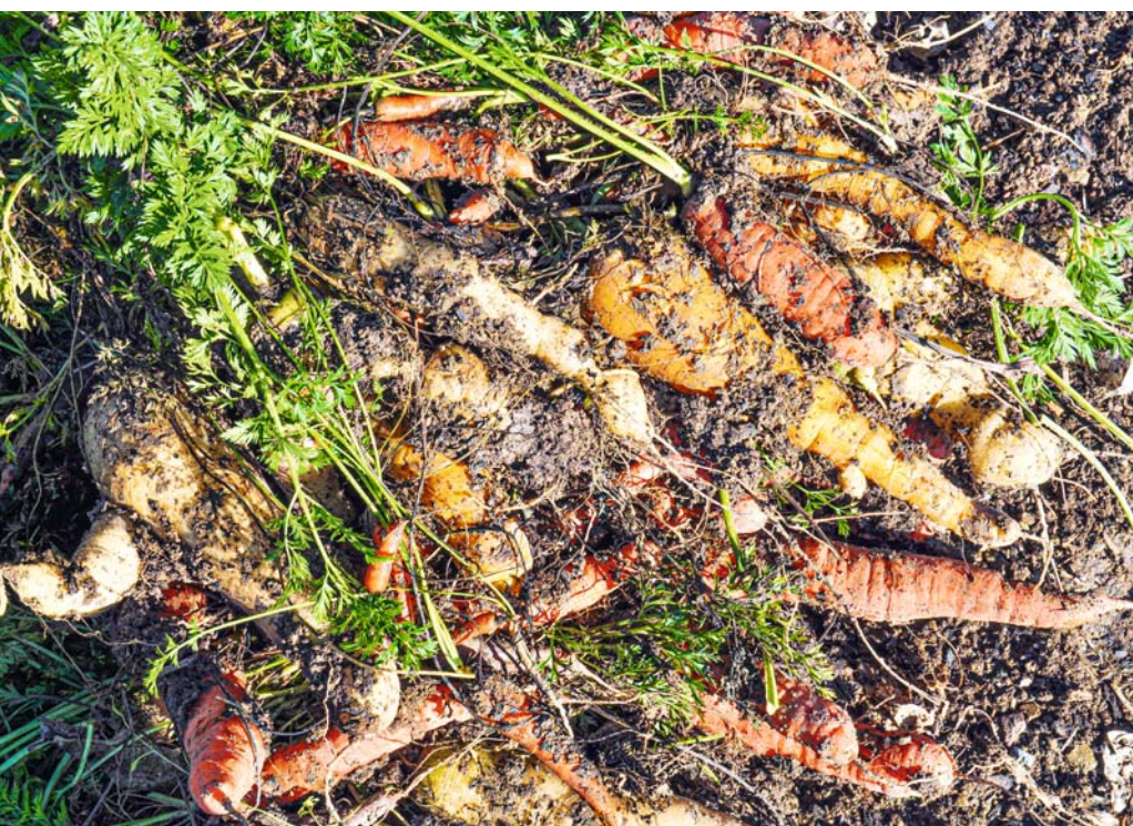
Die eigene Ernte ist leider allzu oft recht uneinheitlich. Rüben mit viel Erde dran gleich sortieren!

man sie durch kräftig rührende Bewegungen. So schrappen sie sich gegenseitig sauber. Abschließend muss man sie natürlich doch noch einzeln in die Hand nehmen, um auch Erdreste in Rillen zu entfernen. Dann kommt alles zusammen in den Ent-