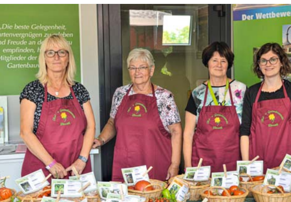
Die Vielfalt von Tomaten, Peperoni und Paprika zeigten die Gartenbauvereine aus Wieseth (Bild) und Windischhausen.