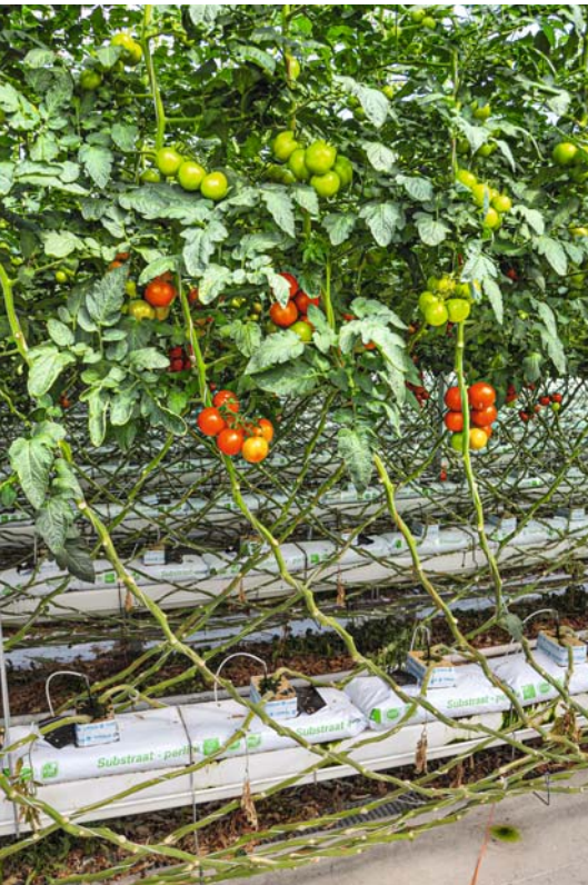
Tomaten im deutschen Profianbau: Gepflanzt wird im Dezember/Januar, abgeräumt im November, wenn jede Pflanze über 10 Meter lang gewachsen ist.

Viele Gartler ernten eigene Tomaten erst ab Juni, mit den zuletzt geernteten gibt es