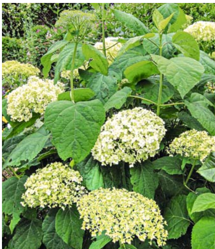
... während bei Schneeball-Hortensie ( H. arborescens 'Annabelle', oben) und manchen Sorten der Bauern-Hortensie die Knospen in diversen Grüntönen gefärbt sind – ein interessanter Kontrast zu den voll ausgefärbten Blüten.