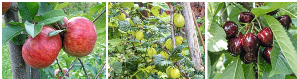
Die richtige Sortenwahl ist entscheidend: schorftolerante Sorten beim Apfel (links), mehltautolerante Sorten bei Stachelbeeren (Mitte), frühe Sorten bei Süßkirschen (rechts).

Der Mindestabstand zum Nachbargrundstück beträgt 0,5 m, bei Gehölzen, die über 2 m hoch werden, sind 2 m einzuhalten. In der freien Flur bzw. gegenüber landwirtschaftlich genutzten Grundstücken gelten andere Regelungen. Hier muss bei Bäumen von mehr als 2 m Höhe ein Abstand von 4 m eingehalten werden. Gemessen wird der Grenzabstand bei Bäumen von der Mitte des Stammes, an der dieser aus dem Boden austritt, bei Sträuchern von der Mitte der zunächst an der Grenze befindlichen Triebe. Geregelt sind diese Vorschriften für Bayern im Ausführungsgesetz zum Bürgerlichen Gesetzbuch.