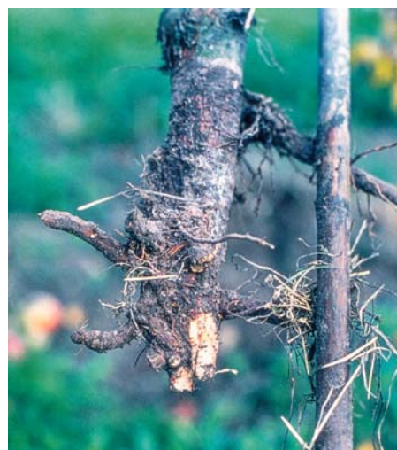
Typischer Wühlmausschaden: abgenagte Stämme. Junge Obstgehölze und solche auf schwachen Unterlagern überleben den Wühlmausbesuch nicht.

Es gibt am Wasser lebende Populationen, die größer und dunkler sind und vor allem in Uferböschungen Nester und Vorratskammern anlegen. Und es gibt die etwas kleineren, Schermaus-Populationen mit etwas hellerem Fell, die auch in unseren Gärten Gangsysteme unter der Erdoberfläche anlegen und Erdhaufen aufwerfen. Sie ernähren sich überwiegend von Wurzeln, Zwiebeln, Knollen – zum Leid von Gartenbesitzern, Obstanbauern, Baumschul- und Gemüsegärtnern. Oft entstehen die Schäden unbemerkt in den Wintermonaten und werden erst im Frühjahr entdeckt. Gefährdet sind vor allem Jungbäume sowie solche auf schwachen Unterlagern.