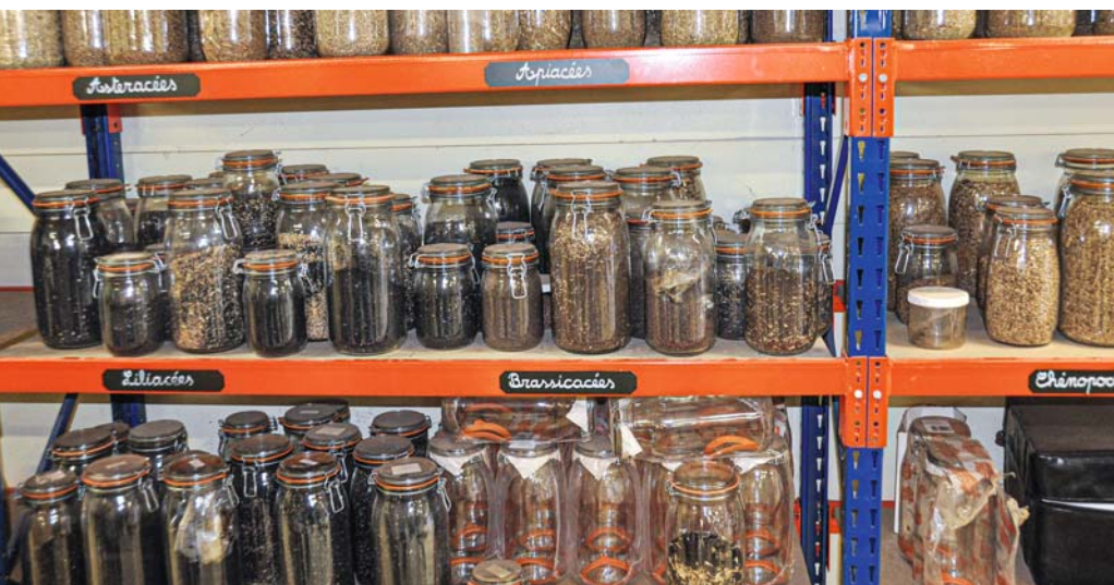
Saatgutvorräte in einer französischen Versuchsstation