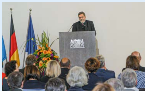
Präsident Wolfram Vaitl bei seinem Grußwort zum Festakt »25 Jahre Bayerische Gartenakademie« im Landwirtschaftsministerium.

zum Beispiel bei der Erstellung von Beratungsunterlagen, Gartenpfleger-Ausbildung, SINUS-Studie oder aktuell bei der Gartenertifizierung und verwies auf Themen wie den Klimawandel und Biodiversität, die uns zukünftig immer mehr beschäftigen werden. Hier gilt es die Garten-