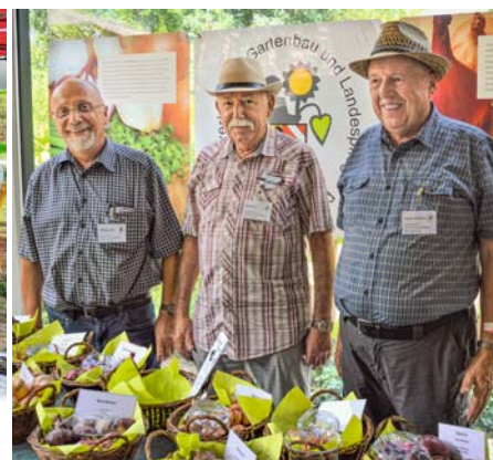
Der Kreisverband Nürnberger Land warb für die Vielfalt der Zwiebel.