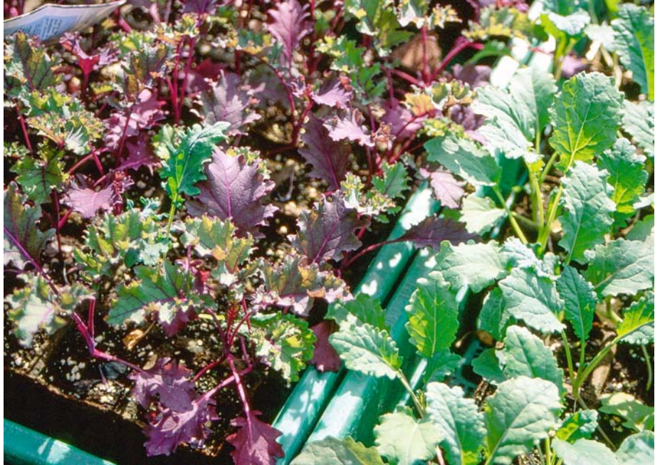
Nach Aussaat im Juni und Pflanzung im Juli können sich bis zum Herbst kräftige Köpfe bilden.

Durch Anzucht im Saatbeet Mitte bis Ende Juni und Pflanzung Anfang bis Mitte Juli auf 40 x 50 cm Abstand entstehen stattliche, je nach Sorte 40–90 cm hohe Köpfe, deren abstehenden Blätter einzeln geerntet werden können.