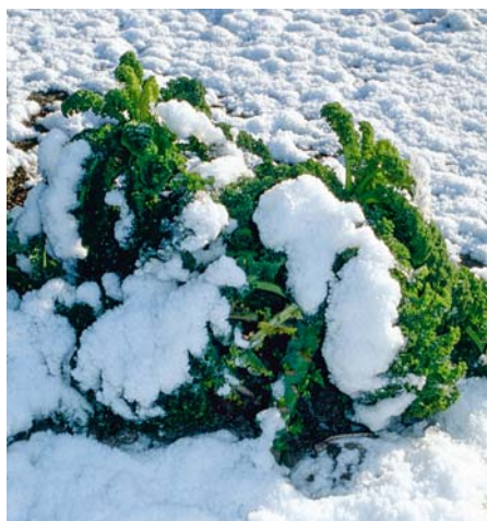
Grünkohl im Schnee (Sorte 'Halbhoher grüner Krauser')

Für die kalte Jahreszeit kommt das auch »Krauskohl«, »Braunkohl« oder »Federekohl« und englisch Kale oder Curly kale genannte Herbst- und Wintergemüse ( Brassica-oleracea-Sabellica -Gruppe) gerade recht. Es enthält viele Vitamine, Mineralien, Ballaststoffe und Kalorien in Form