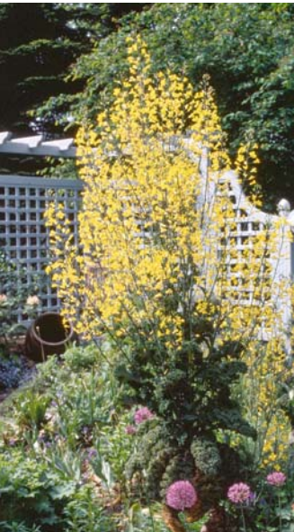
Blühender Grünkohl nach Überwinterung

Russischer Blattkohl ('Russian') stammt aus Sibirien. Er wird bis 60 cm hoch, ist besonders winterhart und hat wenig gekrauste, tief geschlitzte Blätter und Stiele mit dekorativer, türkisblaugrüner Färbung. Sein Geschmack ist mild. Man kann ihn wegen seiner kurzen Kulturzeit gut satzweise als Dichtsaat kultivieren oder über Winter abernten.