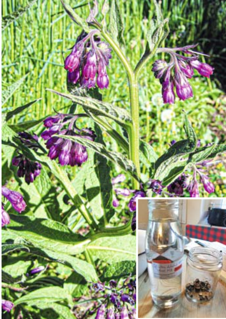
Beinwell. Kleines Bild: Wurzeln in Spiritus einlegen