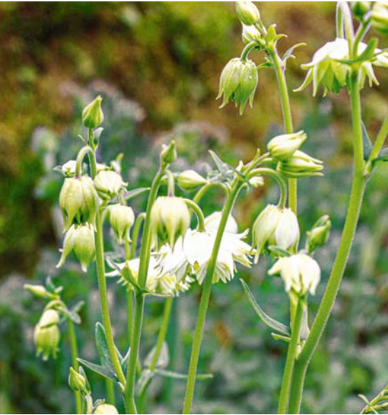
Grüne Knospen und Spitzen machen Blüten wie die der Akelei 'Green Apples' besonders.