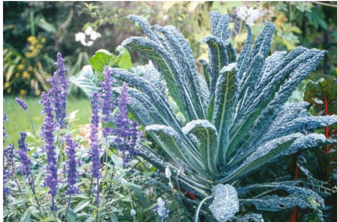
Toskanischer Palmkohl 'Nero precoce di Toscana'

Die besseren, fein gekrausten Kronblätter schmecken nach den ersten Frösten angenehm süßlich. Sie kön-