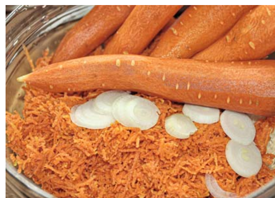
Gelbe Rüben für die Rohkost

safter, der ansonsten meist zur Kartoffelknödel-Zubereitung dient. Frischer Gelberüben-Saft ist ein köstlicher Genuss, kein Vergleich mit gekauftem Karottensaft.