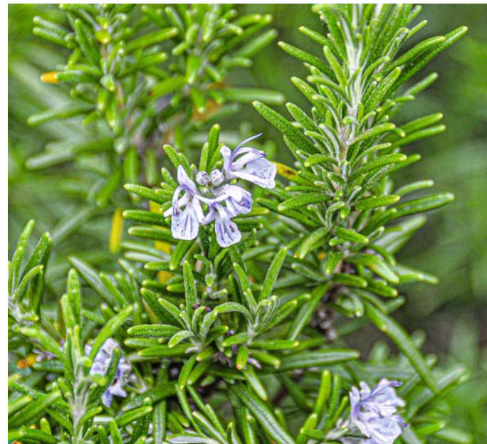
Rosmarinblüten an den Triebspitzen im Frühjahr (im Mai)

feines Gemüse nutzen. Aufgrund der trockenen Sommermonate baue ich zum Beispiel nur noch ungerne Staudensellerie an. Die Herzblätter der Sellerieknollen eignen sich aber ebenso gut wie Stangensellerie zum Beispiel für eines meiner Lieblingsgerichte, nämlich Bruschetta. Wer mehrere Sellerieknollen erntet, kann ja immer nur die zartesten Innenblätter nehmen.