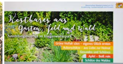
Der gemeinsam vom Bezirksverband Mittelfranken mit den Partnern Landwirtschaft, Forst, Gartenbauzentrum Bayern Mitte und Imker erstellte Flyer sorgte für einen hohen Bekanntheitsgrad in ganz Bayern.