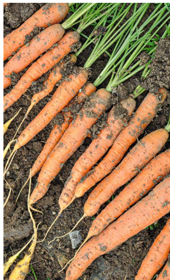
So sehen schöne Gelbe Rüben aus, die rechtzeitig großzügig verzogen worden sind.

Große, aufgeplatzte Wurzeln und die ganz kleinen versaffe ich bald. Die aufgeplatzen werden sauber ausgeschnitten und abgeschrappt. Die kleinen bleiben ein paar Minuten in Wasser, dann säubert