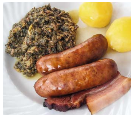
Grünkohl mit Pinkel

Kühle Temperaturen und erste Fröste im Spätherbst lassen den Gehalt an Traubenzucker in den gekrausten Blättern ansteigen. Damit wandelt sich auch der anfangs etwas herbe Geschmack des Grün- oder Federkohls ins angenehm Süßliche. Und damit beginnt in Norddeutschland die »Pinkelzeit«. Wobei sich hinter »Pinkel« eine kräftig schmeckende Mettwurst verbirgt, die man zur Winterzeit zusammen mit Grünkohl genießt.