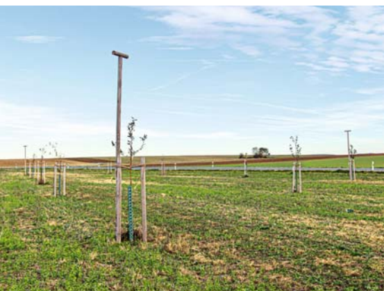
Bei Neupflanzungen im Garten oder auf der Obstwiese sollten ausreichende Pflanz- und Grenzabstände eingehalten werden.

Qualität drückt sich selbstverständlich aber auch in der Echtheit von Sorte und