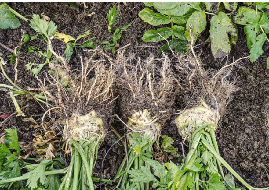
Meistens werden mehrere Sellerie gleichzeitig geerntet. Die inneren Blätter lassen sich wie Stangensellerie nutzen.