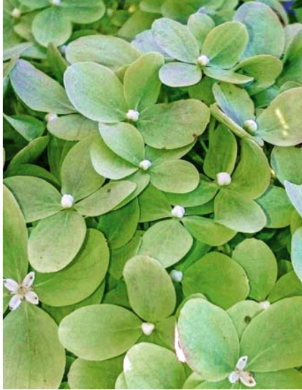
Bei Hydrangea paniculata 'Limelight' sind auch die aufgeblühten Blüten zunächst noch grün ...

Im Gegensatz zu allen anderen Carex , die vollkommen schneckensicher sind, kann C. siderosticha gefressen werden: Zumindest in meinem Garten hat keine einzige der gesetzten 'Variegata' überlebt!