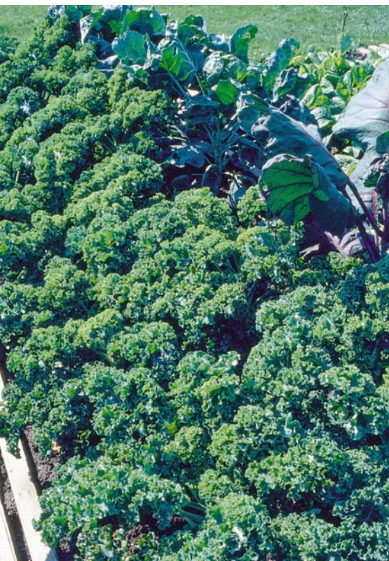
Für die Verarbeitung zu Smoothies wird Grünkohl gerne auch dichter gesät.

Besonders wichtig ist ein jährlicher Fruchtwechsel wegen der Gefahr der im Boden lauernenden Kohlhernie. Auch ein hoher Kalkgehalt des Bodens beugt der Krankheit vor, die sich durch schwaches Wachstum, schlechte Kopfbildung sowie durch stark verdickte Wurzeln äußert. Die Erde sollte nicht zu trocken sein, eine durchgängige Bodenfeuchtigkeit ist günstig. Auf Staunässe jedoch reagieren die Pflanzen mit gelben Blättern und schwachem Wuchs.