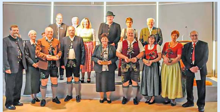
Präsident Wolfram Vaitl mit Vertretern der Gartenbauvereine, die mit dem »Umweltpreis 2019« des Landkreises Bad Tölz-Wolfratshausen ausgezeichnet wurden.

Wolfram Vaitl vertrat den Verband bei Gesprächen im Umweltministerium zur Umsetzung des Volksbegehrens »Artenvielfalt« und nahm am Baustellenfest der Landesgartenschau in Ingolstadt teil. Bei der Verleihung des »Umweltpreises 2019 des Landkreises Bad Tölz-Wolfratshausen« hielt er die Laudatio. Vergeben wurde der Preis an den Garten- und Verschönerungsverein Beuerberg-Herrnhausen, Obst- und Gartenbauverein Königsdorf, Garten- und Verschönerungsverein Benediktbeuern, Gartenbauverein Egling und dem Verein für Gartenbau und Obstpflege Eurasburg. Alle Vereine kümmern sich um die Verwertung des Obstes und liefern so einen wertvollen Beitrag zur Erhaltung alter Bestände und regen Neupflanzungen an.