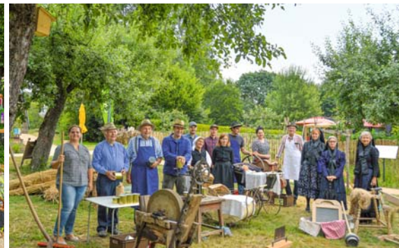
Die Gundelsheimer Heimatfreunde hatten sogar einen Teil des Bauernmuseums dabei.