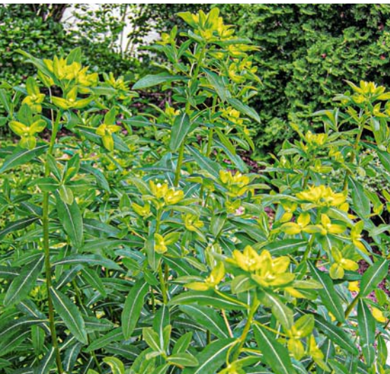
Bei vielen Arten und Sorten der Wolfsmilch wie 'Excalibur' zeigen die Hochblätter ein delikates Farbenspiel zwischen Gelb und Grün.

Feine Grünschattierungen auf eigentlich weißen oder cremeweißen Blüten finden sich auch bei Akelei ( Aquilegia vulgaris 'Green Apples') oder Salomonssiegel (z. B. Polygonatum -Hybr. 'Weihenstephan'). Nicht zuletzt verleiht die Farbe Grün zahlreichen Tulpen-Sorten wie z. B. der Lilienblütigen Tulpe 'Spring Green' oder der Papageien-Tulpe 'Green Wave' ein ganz besonderes Flair.