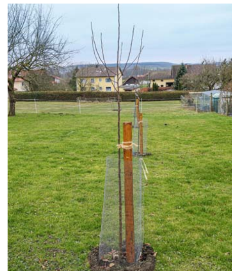
Gutes Pflanzmaterial sollte einen geraden Stamm und eine ausreichende Verzweigung in der richtigen Höhe haben.

Vor der Entscheidung für eine Sorte sollte man sich unbedingt mit diesen Fragestellungen beschäftigen und sich beraten lassen. Die Pflanzung von Obstgehölzen ist eine langfristig angelegte Investition, grundsätzlich vergleichbar mit einem Autokauf, wenn auch deutlich günstiger.