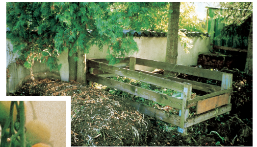
Ein schattiger Platz ist nicht zwingend notwendig, hat aber einige Vorteile.

freiheit für die Durchführung notwendiger Arbeiten wie Auf- und Umsetzen oder Absieben ist mit einzuplanen.