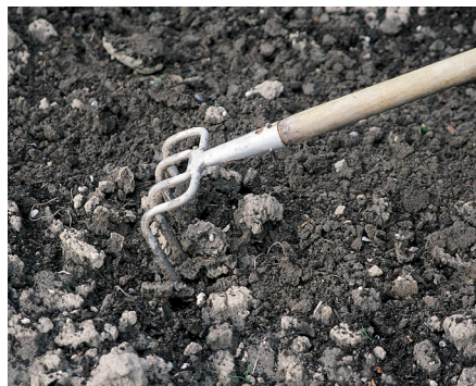
Ein Krail eignet sich sehr gut für die oberflächliche Einarbeitung von Kompost.

Kompost sollte auch nur oberflächlich in den Boden eingearbeitet werden. In der obersten Bodenschicht ist ausreichend Sauerstoff vorhanden für einen weiteren aeroben Ab- und Umbau der im Kompost enthaltenen organischen Substanz. In tieferen Bodenschichten wird Kompost möglicherweise anaerob zersetzt, wobei Pflanzen schädigende Fäulnisprodukte entstehen können.