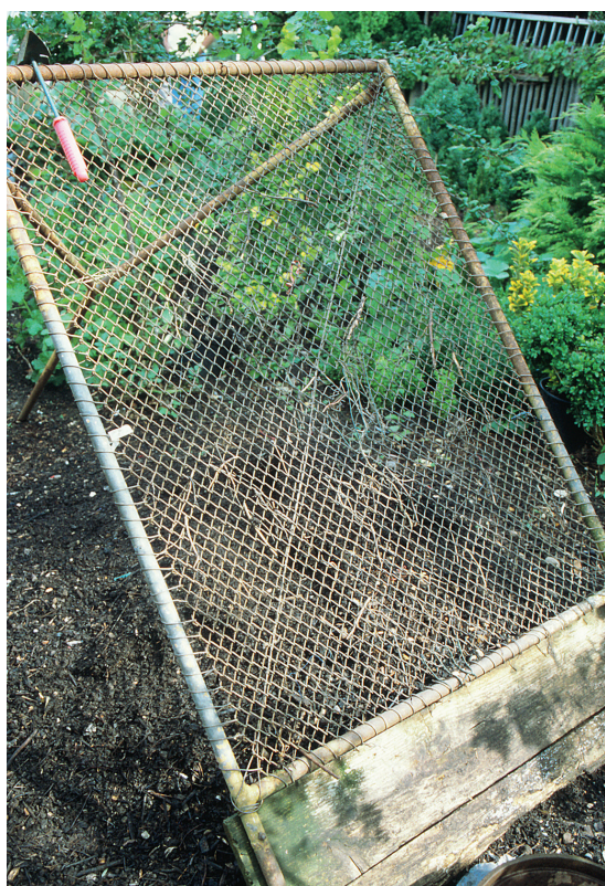
Selbst gebautes Wurfgitter

Umsetzen den Rottevorgang und führt zu einem gleichmäßig verrotteten Kompost, was den Aufwand für diese Arbeit rechtfertigt. Bei einem zu langsamen, ungünstigen Rotteverlauf oder bei auftretenden Problemen wie Fäulnis durch mangelnde Durchlüftung ist ein Umsetzen unumgänglich.