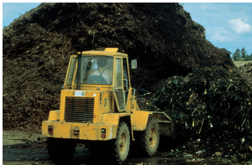
In Kompostwerken werden höhere Temperaturen erreicht und Unkrautsamen zuverlässig abgetötet.

Wurzelunkräuter wie Ackerwinde, Quecke, Giersch und Ackerschachtelhalm, die sich über unterirdische Wurzeläusläufer ausbreiten, könnten auf den Komposthaufen, wenn man sie vorher mehrere Tage in der Sonne trocknen lässt. Selbst kleine Teile der Wurzeläusläufer können, wenn sie noch nicht vollständig abgestorben sind, auf dem Kompost lebensfähig bleiben und wieder austreiben. Deshalb ist auch hier eine Entsorgung über die Bio- oder Restmülltonne sinnvoller.