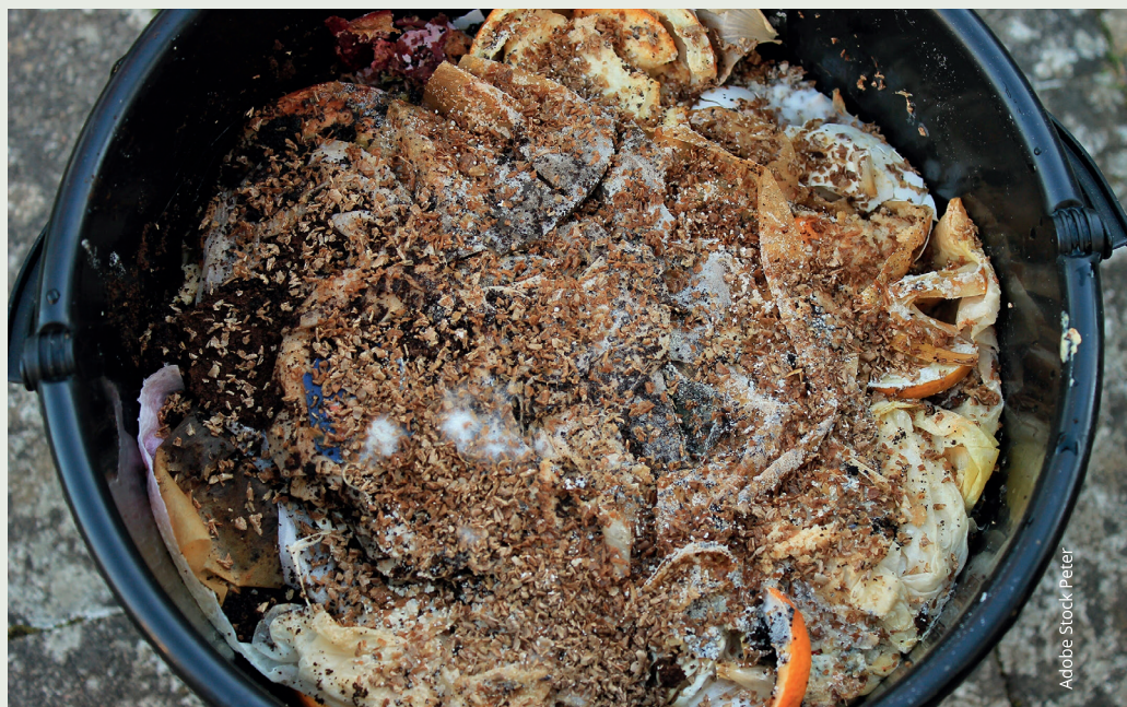
Fertiges Küchen-Bokashi, bevor es vererdet wird

mehr oder weniger so aus wie beim Befüllen, die Farbe hat ein fahles Graubraun angenommen. Manchmal kann sich ein weißer Schimmelpilz bilden, was eher positiv zu bewerten ist. Die Masse riecht süß-säuerlich, ähnlich wie Sauerkraut.