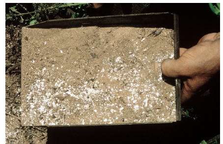
Auf die Zugabe von Asche sollte verzichtet werden.

Kann man Asche aus der Verbrennung von unbehandeltem Holz im eigenen Kamin oder Kachelofen bei der Kompostierung begeben? Holzasche besteht zu einem großen Teil aus Calciumoxid, etwas Kalium und relativ viel Phosphat. Je nach Herkunft des Holzes sind in der Asche durch die Aufkonzentrierung bei der Verbrennung oft gesundheitsschädliche Schwermetalle wie Cadmium, Blei und Chrom in kritischen Mengen nachweisbar. Auch Bor ist oftmals in sehr hohen Mengen enthalten. Zusätzlich liegt der pH-Wert im stark basischen Bereich.