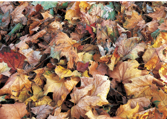
Laub sollte nicht in zu dicken Lagen eingebracht werden. Für größere Mengen bietet sich die Verwendung als Mulch an.

Material von Nadelbäumen enthält Stoffe, die den Abbau und Umbau verlangsamen und daher schwer zu kompostieren sind. Abhilfe schaffen eine vorhergehende Zerkleinerung und gute Durchmischung.