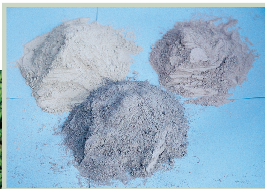
Die Zugabe von Gesteinsmehlen ist in der Regel nicht erforderlich.

Gesteins- und Tonmehle weisen in Abhängigkeit von der Gesteinsart bzw. dem Tonvorkommen stark schwankende chemische Eigenschaften auf. Der Nährstoffgehalt ist meist gering, so dass diese Stoffe – in üblichen Mengen verabreicht – den Nährstoffgehalt im Kompost nicht spürbar erhöhen. Die in den Mehlen enthaltenen Tonminerale können Nährstoffe binden und dienen den Mikroorganismen zum Aufbau von wertvollen Ton-Humus-Komplexen, welche eine günstige Krümelstruktur bewirken.