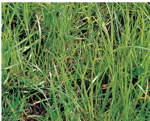
Reifer Kompost kann auch auf dem Rasen ausgebracht werden.

Kompost kann nahezu im gesamten Garten ausgebracht werden, das heißt, nicht nur auf Gemüsebeete, sondern auch zu Stauden, Sommerblumen, Obst- und Ziergehölzen sowie Rasen. Bezieht