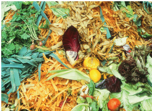
Küchenabfälle werden schnell zersetzt. Eine Abdeckung mit grobem Strukturmaterial schützt vor unangenehmen Gerüchen.

Abfälle aus Küche und Haushalt wie Reste von eigenem oder zugekauftem Gemüse und Obst, Kaffeesatz und Teesamt samt Filter und Papierbeutel, Federn und Haare in kleinen Mengen sind ebenfalls zur Kompostierung geeignet.