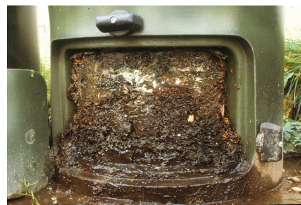
Eine ausreichende Basis aus strukturstabilen Materialien kann helfen, Verdichtungen, Nässe und Fäulnisgerüche zu vermeiden.

Zu nasser Kompost weist häufig unangenehme, faulige Gerüche auf. Die sauerstoffbedürftigen Mikroorganismen können ihre Aktivitäten nur in geringem Maße entfalten. Ein Kompost ist zu nass, wenn man eine Handvoll mit der Faust fest zusammendrückt und dabei Wasser aus der Masse herausläuft.