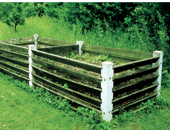
Lattenkomposter mit Betonsäulen: Günstig, langlebig, arbeitsleichternd

Bei so genannten Schnellkompostern wird bei einigen Modellen mittels einer Dämmung die Wärmeabgabe verringert. Allerdings wird selten eine deutliche Temperaturerhöhung im Kompost bewirkt. Die Rottedauer kann sich verkürzen, aber nicht auf wenige Wochen, wie häufig beworben wird.