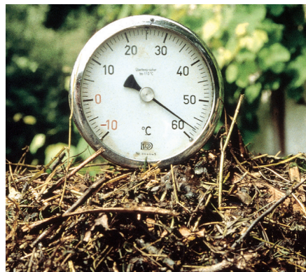
Mit einem Kompostthermometer bekommt man schnell einen guten Überblick über die aktuelle Entwicklung des Verrottungsprozesses im Komposthaufen.

Für die Abbau- oder Heißrottephase sind Temperaturen über 50 °C charakteristisch. In dieser Phase sind hauptsächlich wärmeliebende Bakterien tätig, die durch die frisch aufgesetzten, stickstoffreichen Abfälle reichlich Nahrung erhalten, wodurch sie sich fast explosionsartig vermehren und Wärmeenergie freisetzen.