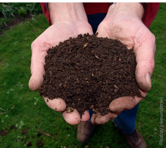
Reifer Kompost: Das „braune Gold“ des Freizeitgärtners

Zur Herstellung von Blumenerde sollten nur reife Komposte eingesetzt werden, deren Pflanzenverträglichkeit mit einem einfachen Kresstest geprüft werden kann.