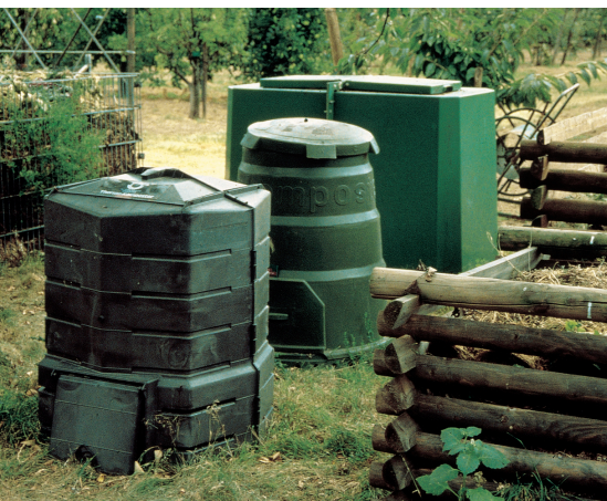
Auf dem Markt gibt es eine Vielzahl an geschlossenen Kompostbehältern.

Bei so genannten Schnellkompostern wird bei einigen Modellen mittels einer Dämmung die Wärmeabgabe verringert. Allerdings wird selten eine deutliche Temperaturerhöhung im Kompost bewirkt. Die Rottedauer kann sich verkürzen, aber nicht auf wenige Wochen, wie häufig beworben wird.