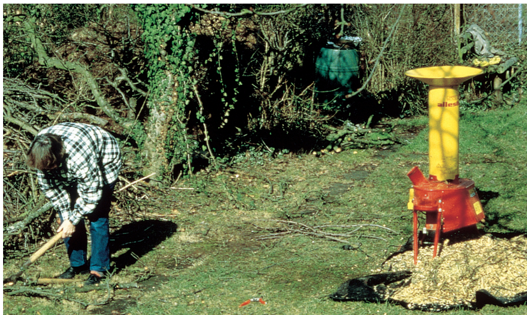
Gartenhäcksler gibt es in vielen praxistauglichen Ausführungen.

Ein richtig aufgesetzter Kompost braucht in der Regel nicht zwingend noch einmal umgesetzt werden. Während der Rotte verändert sich aber die Struktur des Komposts. Organische Substanz wird abgebaut und durch sein Eigengewicht