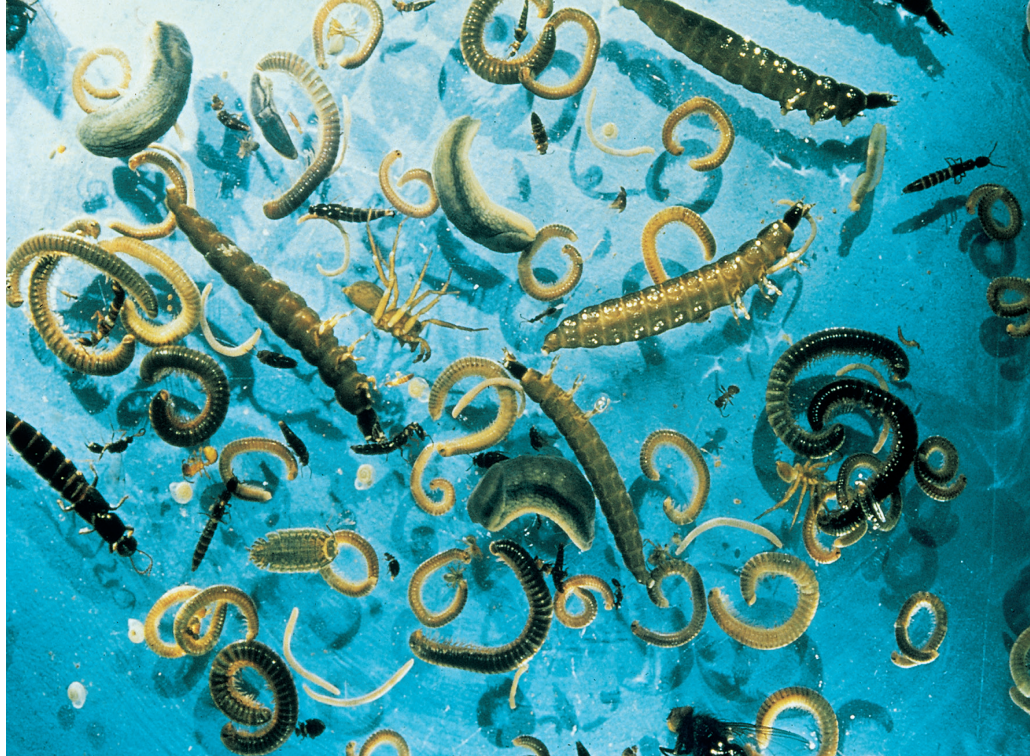
Ein Milliardenheer an kleinen und kleinsten Lebewesen sorgt für die Umsetzungsvorgänge. Geht es ihnen gut, ergibt es einen guten Kompost.

sackt der Kompost zusammen und verdichtet sich. Dadurch verschlechtert sich der Luftaustausch im Inneren der Miete. Unterschiede in Feuchtigkeit und Temperatur zwischen Kompostkern und den äußeren Bereichen verhindern, dass das Material in allen Bereichen gleichmäßig verrottet. Die Rotte wird weiter ablaufen, es wird einen gut verwertbaren Kompost geben, es dauert nur länger. Mit dem Umsetzen wird das Rottegut erneut gelockert und belüftet. Ferner kann man Feuchteunterschiede ausgleichen und Material vom kühleren Rand des Komposts in das wärmere Zentrum verlagern. Insgesamt beschleunigt ein