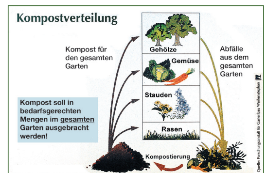
Die Ausgangsstoffe für den Kompost stammen aus dem ganzen Garten. Somit sollte auch die gesamte Gartenfläche in die Kompostausbringung einbezogen werden.

Kompost verbessert den Boden nachhaltig und steigert die Bodenfruchtbarkeit. Hierbei sind nicht etwa üppige Mehrerträge zu erwarten, vielmehr werden die Widerstandskraft der Pflanzen und die Ertragssicherheit erhöht. Im Einzelnen