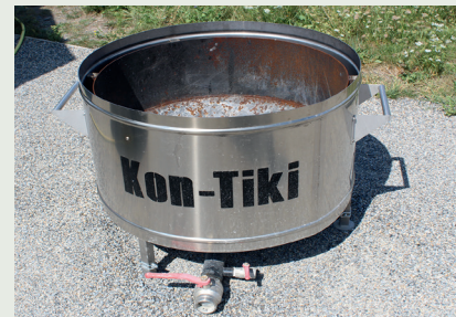
Kon-Tiki-Ofen zur Selbsterstellung von Pflanzenkohle

weisen. Gewöhnliche Holzkohle, die zum Grillen oder Kochen verwendet wird, ist mit Pflanzenkohle nicht vergleichbar und kann nicht für die Verwendung empfohlen werden.