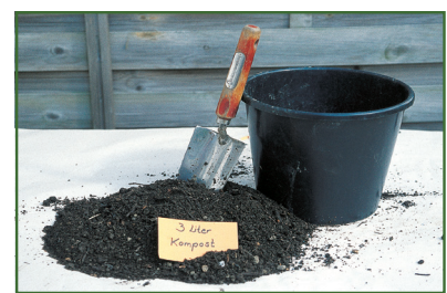
Drei Liter Kompost erscheinen nicht viel, sind aber i. d. R. für 1 m 2 ausreichend.

Mehr Kompost kann gegeben werden, wenn man z. B. 3 oder 4 Gemüsekulturen pro Jahr auf derselben Fläche anbaut, von der außerdem sämtliche Ernterückstände und Putzabfälle abgeführt werden, oder wenn man den Rasen häufig mäht und das Schnittgut immer komplett entfernt.