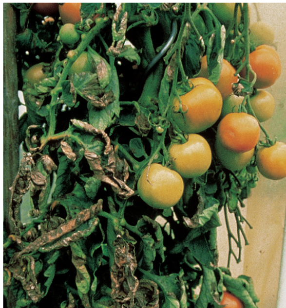
Von der Kraut- und Braunfäule befallene Tomaten sind besser über die Biotonne oder den Wertstoffhof zu entsorgen.

Auch Tomaten und Kartoffeln mit Kraut- und Braunfäule sind zur Sicherheit der professionellen Kompostierung zuzuführen.