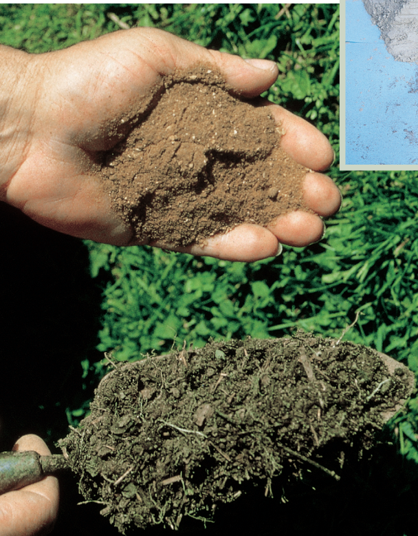
Kompoststarter (oben) sind nicht notwendig. Wer möchte, kann etwas ältere Komposterde (unten) dazugeben.