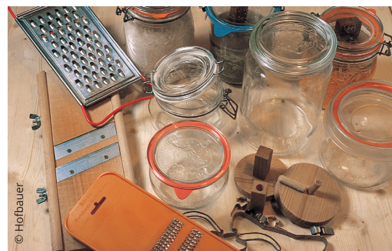
Gemüsehobel, -raspel, Einmachgläser und Stampfer zum Verdichten sind wichtige Hilfsmittel fürs Fermentieren.

Altes Wissen ist wieder gefragt. Den Speiseplan mit fermentiertem Gemüse zu bereichern, liegt im Trend. Besonders bei jungen Leuten im städtischen Bereich findet das Fermentieren immer mehr Zuspruch. Die überlieferte Methode weckt Neugier und Experimentierfreude. Es lohnt sich, verschiedenes Gemüse auszuprobieren, denn dieses Hobby erfordert keine große Investition, es können kleine Mengen produziert werden und gleichzeitig ist es ein Ansporn für eine bewusste, gesunde Ernährung.