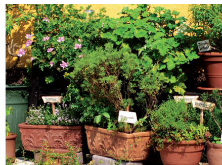
Für die Konservierungsmethode des Trocknens sind besonders Kräuter geeignet.

Das Trocknen ist die älteste Konservierungsmethode, sie wird hauptsächlich bei Kräutern, weniger bei Gemüse angewendet. Die Kräuter sollten vor dem Trocknen nicht gewaschen werden, sonst kann sich Schimmel bilden. Da Pflanzen zu 70 bis 90 % aus Wasser bestehen, beeinflusst der Trockenprozess die Qualität der getrockneten Kräuter erheblich.