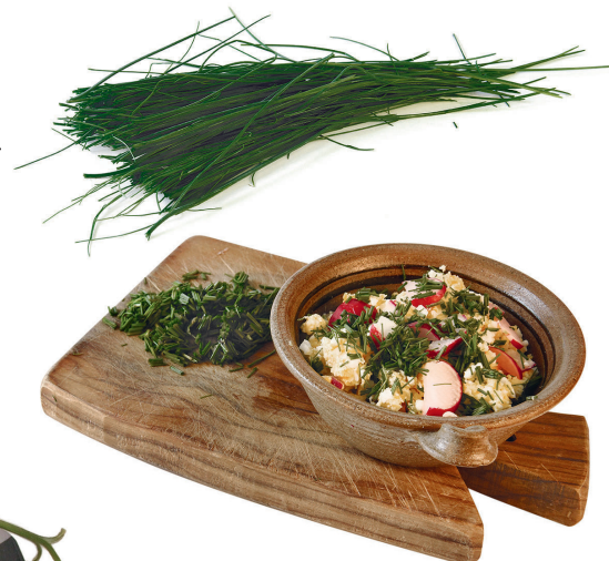
Wilden Schnittlauch (oben, Winterernte) und Schnittlauch aus dem Garten kann man für deftige Eieraufstriche verwenden.

cken an geschützten Stellen. Bei genauer Naturbeobachtung kann man ihn schon ab Dezember entdecken und ernten. Er entwickelt bis April seine Röhrchen, und dann zieht er sich allmählich zurück und zeigt sich erst wieder, wenn es kalt wird. Die Natur hat es weise eingerichtet, denn während der Vegetationszeit gibt es den kultivierten Gartenschnittlauch.