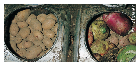
Knollen- und Wurzelgemüse kann man sowohl in Sand einlegen als auch in Erdtrommeln lagern.

Früher gab es mehr geeignete Keller, um Gemüse und Obst zu lagern. Die optimale Raumtemperatur eines Kellers sollte 8 °C betragen und die Luftfeuchtigkeit 80 %. In den wenigsten Häusern gibt es diese Voraussetzungen. Die Keller sind meist zu trocken und zu warm, weswegen das