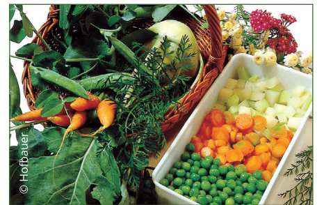
Gemüse vor dem Einfrieren blanchieren

Was ist beim Einfrieren zu beachten? Nur frische Ernte und beste Qualität verwenden. Das Gemüse waschen, evtl. zerkleinern und blanchieren. Dabei wird das Gemüse kurz in kochendes Wasser gegeben und sofort kalt abgeschreckt. Dann abtropfen lassen und sofort luftdicht verpackt in Gefrierbehältern einfrieren.