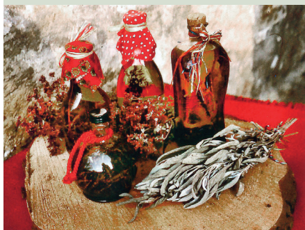
Kräuteröl lässt sich in großer Vielfalt leicht selber herstellen...

Alles in eine große Flasche füllen. Der Flascheninhalt wird täglich einmal geschüttelt. Nach 4 Wochen können die Kräuter und Gewürze entfernt werden. Das Kräuteröl eignet sich zum Würzen von Fleisch, Salaten oder Bratkartoffeln.