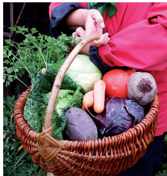
Aus dem eigenen Garten kann man eine große Fülle saisonaler Gemüsearten verwerten und somit einen Beitrag zur Nachhaltigkeit leisten.

Kurze Transportwege, v. a. beim Gemüseanbau im eigenen Garten, verbessern die Ökobilanz im Gegensatz zu Importware aus fernen Ländern – nehmen wir als Beispiel nur einmal Avocados aus Südamerika: Diese Frucht wird in Großplantagen als Monokultur angebaut und hat einen sehr hohen Wasserverbrauch. Wasser ist dort sehr knapp, es wird von den Großplantagen den benachbarten Kleinbauern entzogen und dadurch deren Existenzgrundlage vernichtet. Unser Verbraucherverhalten und unsere Essgewohnheiten haben also eine weltweite Auswirkung!