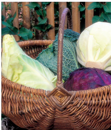
Verschiedene Kohlarten eignen sich besonders zum Fermentieren.

Fermentierte Kost hat besonders für unsere Darmflora gesundheitliche Vorteile. Sie ist „lebendige Nahrung“ und hat einen günstigen Einfluss auf das Immunsystem. Die vorhandenen Milchsäurebakterien wandeln die im Gemüse enthaltenen Zuckerarten in Milchsäure um. Die Milchsäurevergärung hat den Vorteil, dass die Vitamine weitgehend erhalten bleiben, außerdem wird Lactose zu Milchsäure abgebaut. Das Gemüse wird bekömmlicher, schmeckt gut und ist die ideale Salatbeilage, zumal es nach der Vergärung fix und fertig ist und jederzeit zur Verfügung steht. Portionsweise in kleine Gläser abgefüllt kann es auch zum Arbeitsplatz mitgenommen werden.