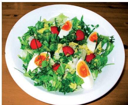
Saisonale Freilandsalate sind sowohl für die Gesundheit als auch für das Auge eine Wohltat.

Zu bevorzugen ist eigene oder regional angebotene saisonale Frischware, möglichst aus ökologischem Anbau. Kopfsalat ist im Sommer weit weniger mit Nitrat belastet als im Winter. Tiefkühlgemüse ist nitratärmer als Treibhausgemüse, weil es im Sommer gewachsen ist und sofort eingefroren wird.