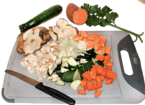
Buntgemischte Zutaten für einen Topinambur-Gemüse Eintopf

Bei Bedarf wenig Wasser dazugeben, mit Kräutersalz oder Gemüsebrühe-Würze abschmecken, ca. 8–10 Minuten garen und mit verschiedenen frischen Kräutern servieren.