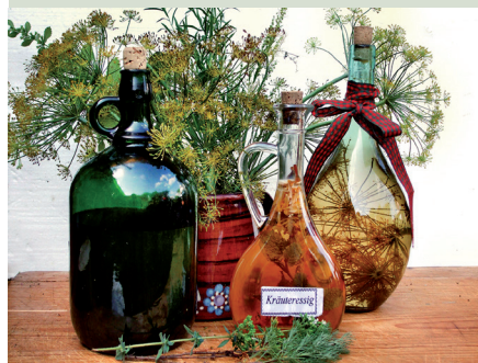
...ebenso wie Kräuteressig, bei dem es beinahe unendliche Variationsmöglichkeiten gibt.

Frische Kräuter waschen, Stiele entfernen. Zwiebeln und Knoblauch schälen, grob zerkleinern. Alles zusammen in große Flaschen oder Ballone geben. Vier Wochen durchziehen lassen, abseihen und in Flaschen füllen.