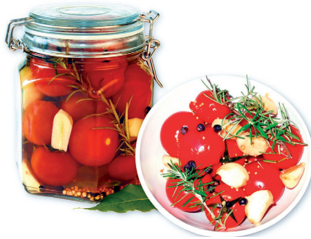
Marinierte Cocktailtomaten – nicht nur ein geschmacklicher, sondern auch ein optischer Genuss

Marinade-Cocktailtomaten halten sich mindestens vier Wochen, wenn sie kühl und dunkel stehen.