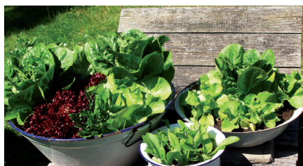
Mit Gemüse bepflanzte Emailleschüsseln und -töpfe lassen sich auf Schubkarren als „mobile Hochbeete“ einsetzen.

Großmutter's alte Teigschüsseln, wie man sie früher in jedem Haushalt vorfand, eignen sich besonders für den Salatbau. Die Salatköpfe wachsen hier wie die „Schwammerl“ und sind vor Schneckenfraß geschützt.