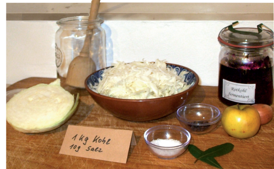
Wichtig für das Fermentieren ist gesundes, sauberes, zerkleinertes Gemüse als Ausgangsmaterial.

Es ist spannend, zu experimentieren und sich an verschiedenes Gemüse heran zu wagen – viel Erfolg.