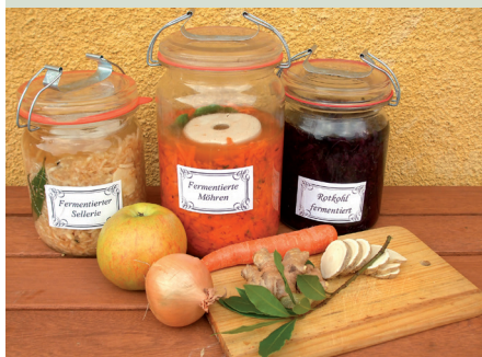
Sellerie, Möhren und Rotkohl lassen sich gut fermentieren und ergeben gesunde und farblich ansprechende Produkte.

Beschwerstein oder ein kleines Glas mit Wasser daraufsetzen. Deckel auflegen und ca. 8 Tage bei Zimmertemperatur fermentieren lassen, täglich kontrollieren. Wenn das Gemüse leicht säuerlich schmeckt, ist es fertig. Anschließend das Glas fest verschließen und in den Kühlschrank stellen.