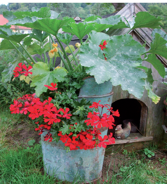
Alte Fässer müssen nicht entsorgt werden, sondern können als Pflanzgefäß für Kürbis und Balkonblumen dienen.

Alte Emailleschüsseln und Blechwannen sind nicht nur ein Blickfang im Garten, sie bringen auch reiche Ernte. Bevor die alten Utensilien auf dem Müll landen, sollte man prüfen, ob sie neuen Zwecken zugeführt werden können.