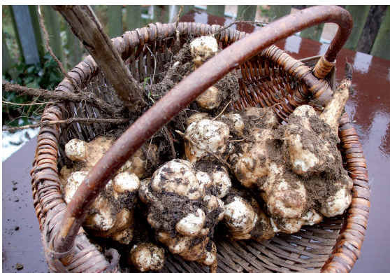
Reiche Ernte an wertvollen Topinamburknollen

Auch auf Bauernmärkten und im regionalen Handel gibt es dieses Saisongemüse zu günstigen Preisen, z. B. Rote Bete, Sellerie, Möhren oder Pastinaken. Einiges kann direkt frisch den ganzen Winter über geerntet werden, z. B. Topinambur und Schwarzwurzeln.