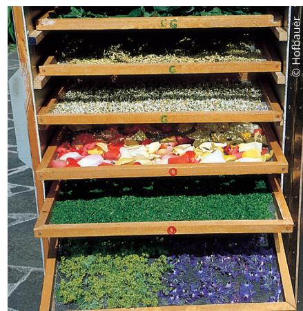
Kräuter – und auch Blüten – kann man auf mit Stoff bespannten Holzrahmen trocknen.

Die Kräuter in kleinen Büscheln an die Leine hängen und sofort abnehmen, wenn sie trocken sind. Gut bewährt hat sich, wenn dicke Stängel (z. B. bei Minze und Melisse) gleich nach der Ernte entfernt werden und die Kräuterblätter locker auf einen mit luftdurchlässigem Stoff bespannten Holzrahmen ausgebreitet werden.